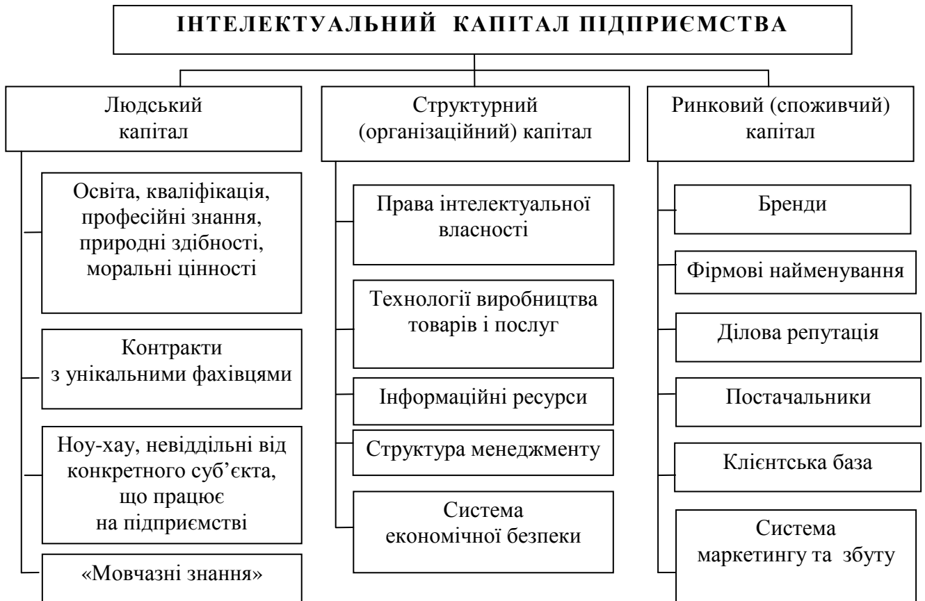
Рис. 1. Структура інтелектуального капіталу підприємства

Таким чином, інтелектуальний капітал запропоновано розуміти як сукупність знань, досвіду, вмінь працівників, відносин зі споживачами та партнерами, брендів, ділової репутації та інших невідчутних елементів, за допомогою яких створюються продукти інтелектуальної власності, отримується додатковий прибуток й забезпечується конкурентоспроможність підприємства на ринку.