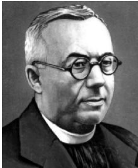
Августин ВОЛОШИН (1874–1945)

Авторська концепція. Августин Волошин зумів висловити ідейні погляди українського народу на проблему національного становлення шляхом розвитку культурно-освітнього рівня населення у поєднанні із пропагуванням ідей націоналізму, толерантності, гуманізму та