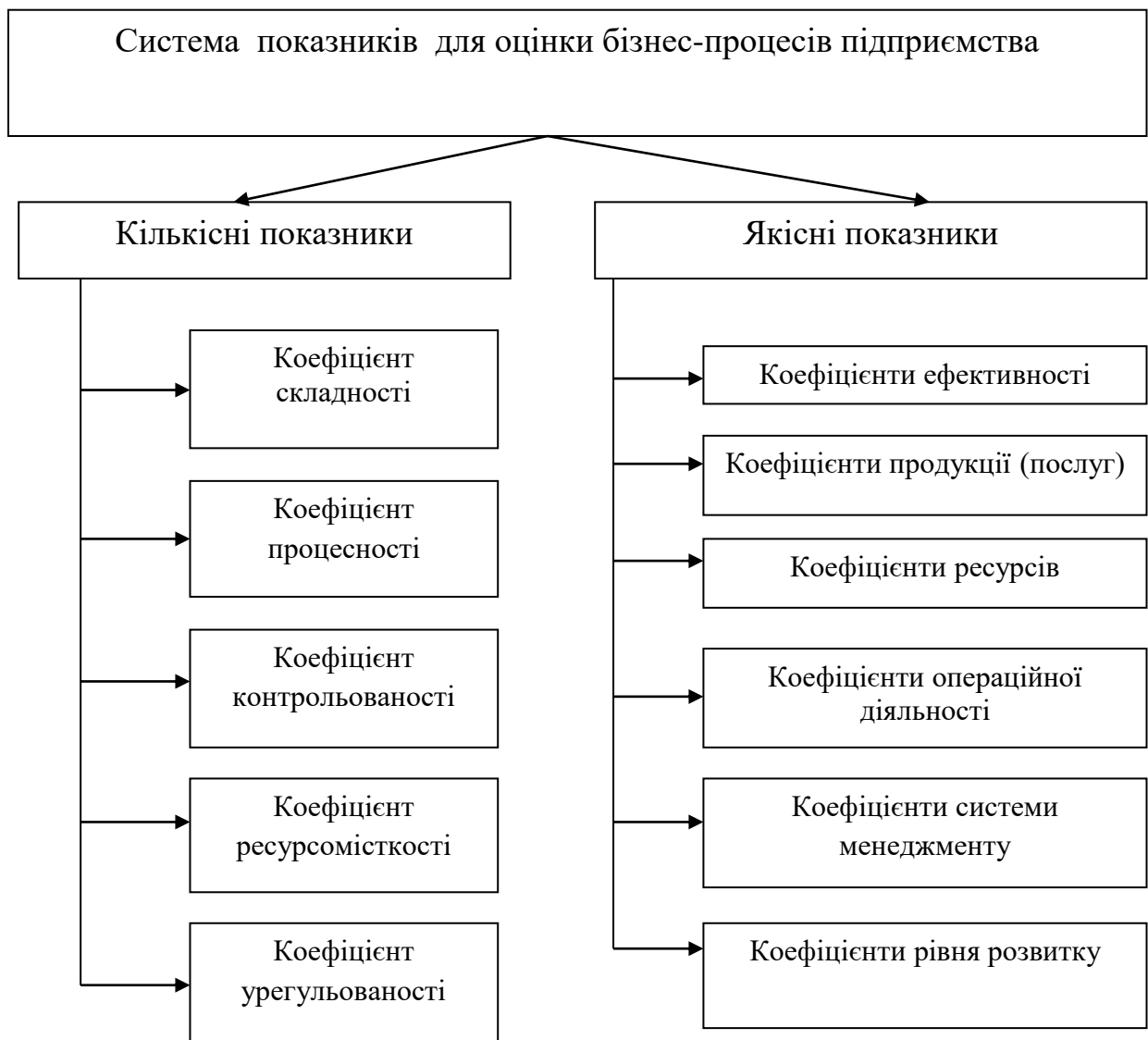
Рис.3. Система показників що характеризує ефективність бізнес-процесів підприємства

поточної ситуації. Отримати вичерпну інформацію про діяльність і розвиток підприємства можна за допомогою кількісних та якісних економічних показників. Формування та впровадження системи показників буде сприяти обґрунтованому плануванню, дієвому контролюванню і регулюванню розвитку підприємства. Для оцінки бізнес-процесів підприємства використовують систему кількісних та якісних показників (рис. 3).