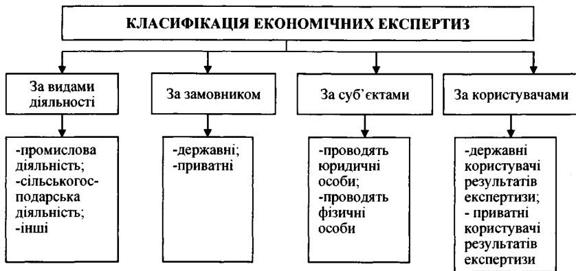
Рис. 1. Класифікація економічних експертиз в Україні

В подальшому коротко охарактеризуємо види економічних експертиз в Україні. За галузку (видами діяльності) розрізняють економічні експертизи промислових, сільськогосподарських підприємств та ін. Економічні експертизи можуть бути ініційовані як органами суду і досудового розслідування, так і приватними особами. Такі експертизи можуть проводитися у випадку судового розгляду, банкрутства підприємства, розподілу чи передачі майна у володіння іншій особі для з'ясування фінансових показників і т.д.