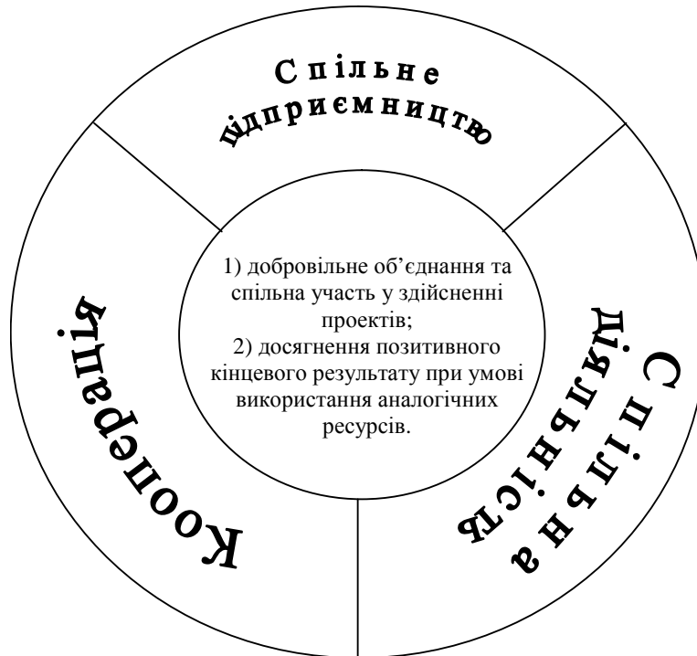
Рис. 3. Взаємозв'язок спільної діяльності із спільним підприємництвом та кооперацією