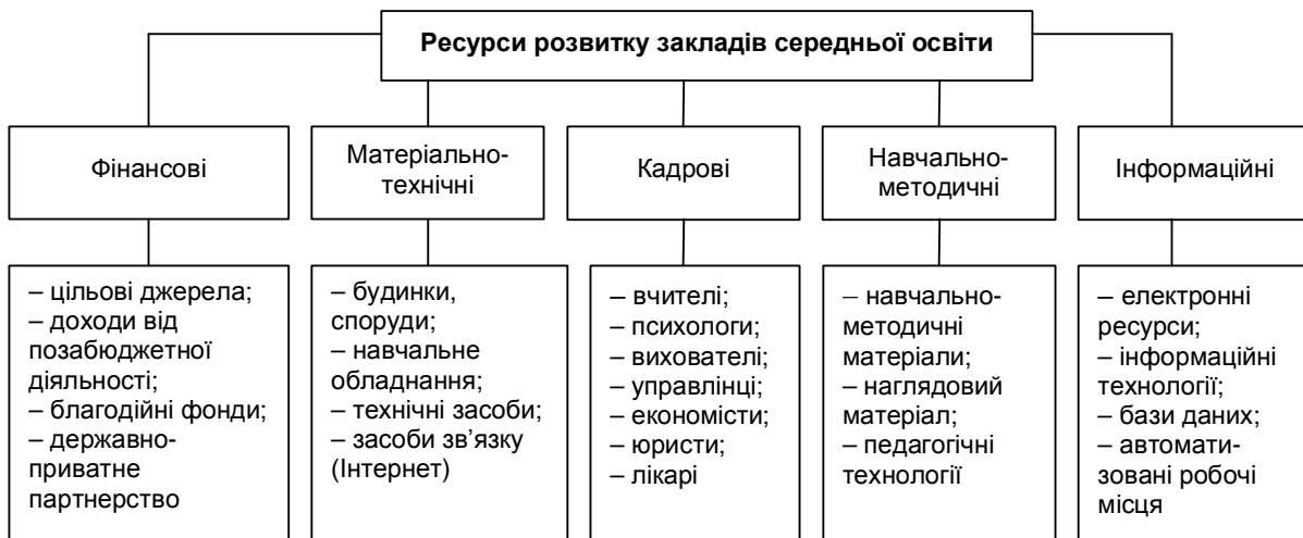
Рис. 2. Класифікація ресурсів розвитку середньої освіти за їх економічною сутністю