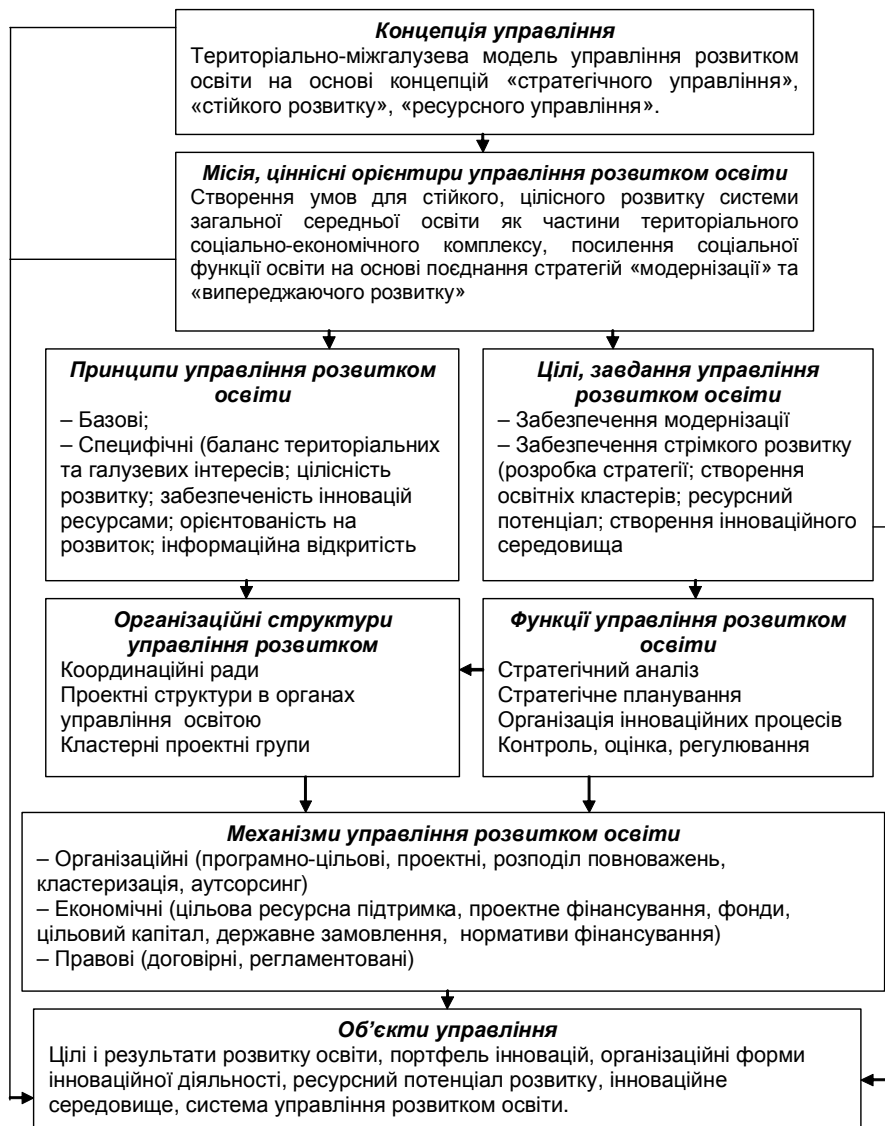
Рис. 5. Концептуальна модель управління розвитком системи загальної середньої освіти

В найбільш узагальненому вигляді модель управління розвитком закладів середньої освіти представляється як сукупність блоків, що включають основні елементи системи управління, та сукупність необхідних і достатніх зв'язків між цими елементами (рис. 5).