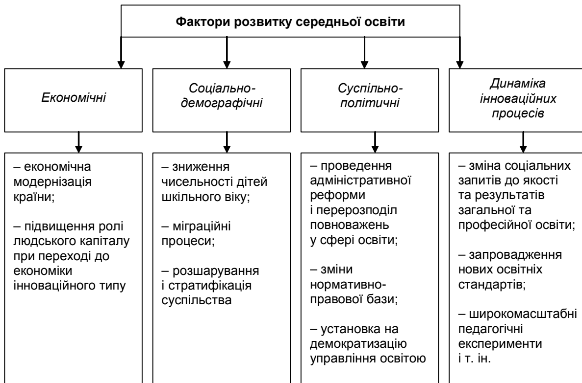
Рис. 1. Основні фактори, що впливають на стратегію розвитку середньої освіти в Україні

Сучасні дослідники приділяють велику увагу відносно новим (для сфери освіти) підходам і методам, що дають змогу підвищити якість управління розвитком. Виходячи з досвіду зарубіжних країн, було згруповано і проаналізовано фактори, які впливають на розвиток освіти та загальної середньої освіти зокрема, що представлені на рис. 1.