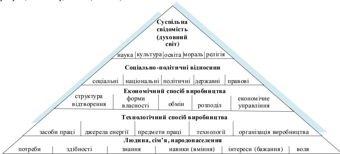
Рис. 1. Система цінностей та елементи "піраміди цивілізацій" [8, с. 90]

Структурно цивілізація є складним соціальним організмом, що формує так звану "піраміду цивілізацій", незалежно від приналежності до певного виду локальної цивілізації (рис. 1), відповідно порушення системності такої конструкції, зміна будь-якого її елемента всупереч законам системи руйнує цю систему, тобто цивілізацію.