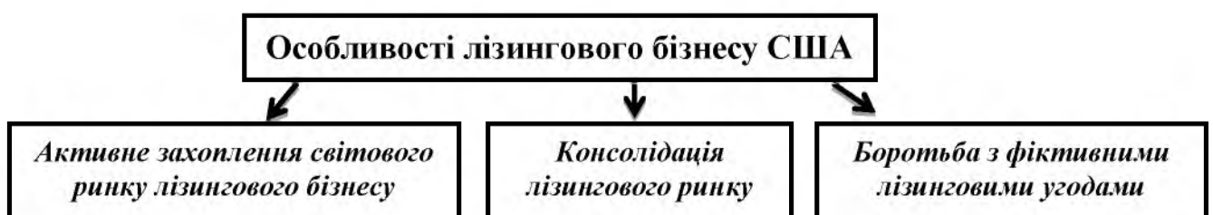
Рис. 2. Характерні риси лізингу в США

Також яскравим прикладом для наслідування є ринок лізингових послуг США. Лізинг у США визнаний прогресивним інвестиційним джерелом оновлення основних засобів, його використання стимулювалося через запровадження урядом спеціальної програми розвитку. Характерні риси, які притаманні для лізингу в США, представлені на рис. 2.