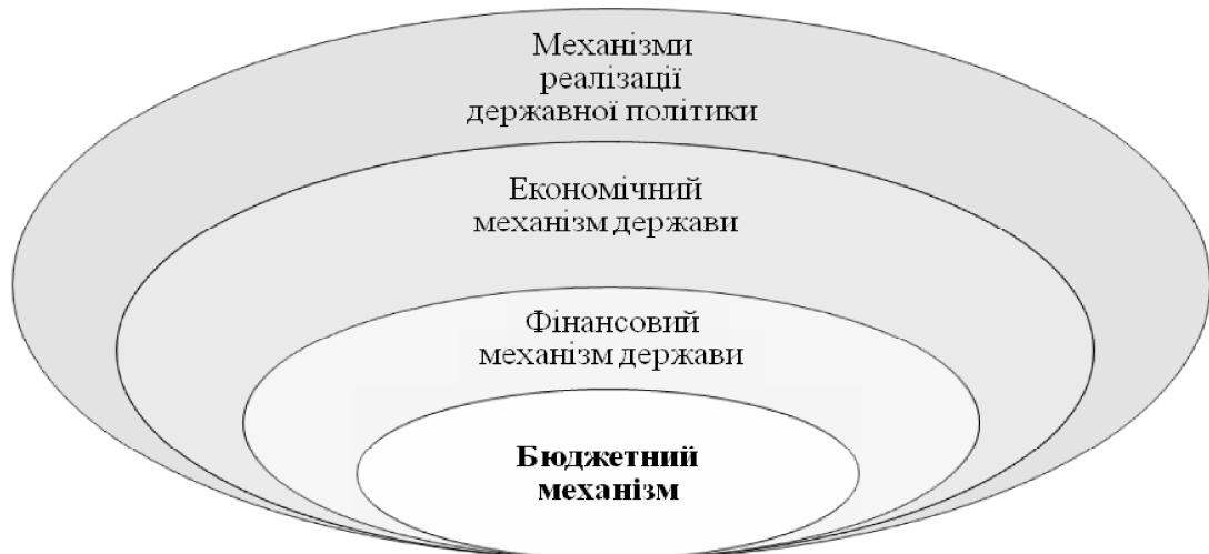
Рисунок 1 - Взаємозв'язок бюджетного механізму з фінансовим, економічним механізмами та механізмом реалізації державної політики

Характеризуючи теоретичні та практичні засади бюджетного механізму зазначимо, що він є складовою фінансового механізму, має багато з ним спільних рис. Враховуючи, що фінансова політика є складовою економічної політики, механізм її реалізації включає фінансовий механізм держави. Аналогічно економічний механізм є одним із механізмів реалізації різних видів державної політики (рис. 1).