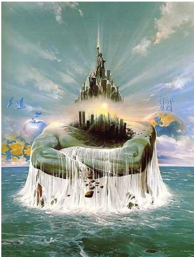
Рис. 2. Картина В. Сюдмака “Найсильніший”

П: Наступний малюнок – це репродукція “Найсильніший” (рис. 2). Коли я дивлюсь на цей малюнок, то в мене виникають відчуття, що це неначе акт самонародження. Чи є в тебе бажання самонародитись? Скинути той хрест, що несеш (рис. 1), відчуття полегшення?!