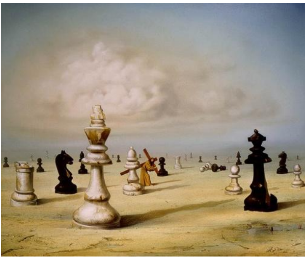
Рис. 1. Картина З. Задемака

П: Вибери ті малюнки, які будуть для тебе емоційно небайдужими. Розклади, будь ласка, їх один за одним за їх значущістю для тебе. Вибери малюнок, з якого будемо розпочинати роботу. (До залу): ми спіраємося на те, що психіка людини знає все, але свідомому ці знання недоступні. Потрібно працювати, щоб ці знання стали надбанням свідомості й допомогли в її особистісному зростанні. Приступаємо до обговорення малюнку. Розкажи, що ти бачиш на рис. 1 .