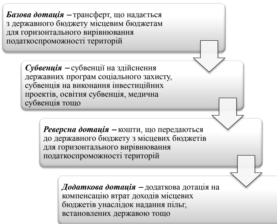
Рис. 2. Класифікація міжбюджетних трансфертів