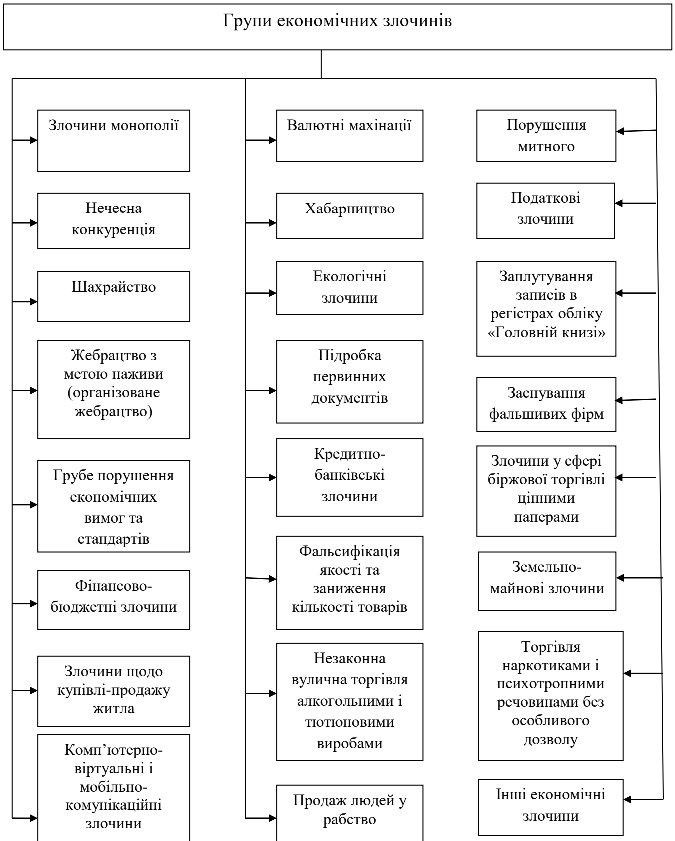
Рис.1. Класифікація економічних злочинів [3, с.9]

Економічні злочини можна класифікувати за групами, поданими на рис.1.