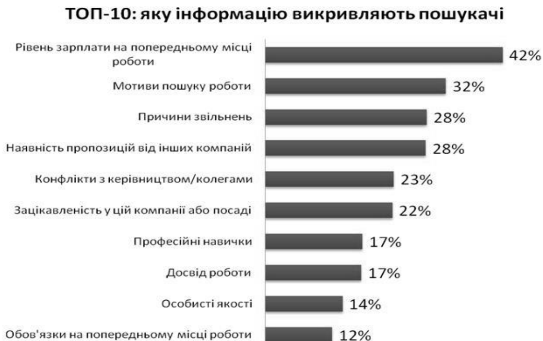
Рис. 4. Перелік неправдивої інформації, яку найчастіше надають шукачі роботи [5].

При цьому варто також врахувати, що пошукувачі роботи нерідко надають неправдиву інформацію під час співбесіди чи складання резюме, що вкрай негативно позначається на їх подальшому працевлаштуванні (рис. 4).