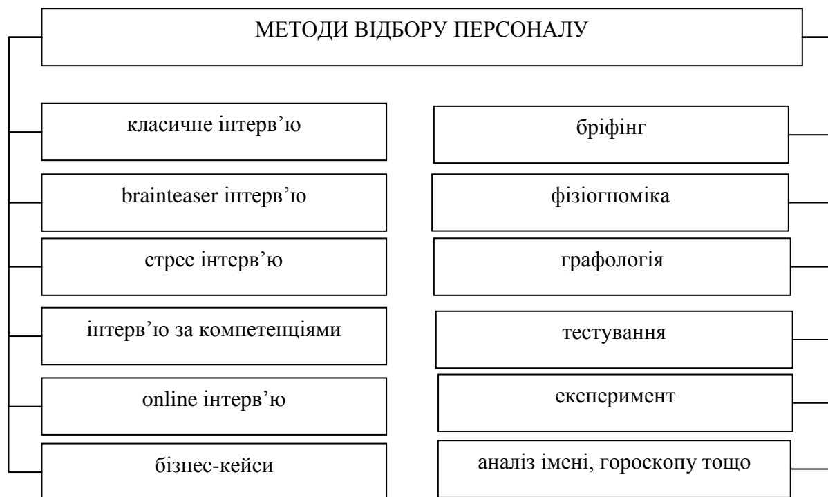
Рис. 3. Сучасні методи відбору кадрів на підприємствах.

При цьому варто також врахувати, що пошукувачі роботи нерідко надають неправдиву інформацію під час співбесіди чи складання резюме, що вкрай негативно позначається на їх подальшому працевлаштуванні (рис. 4).