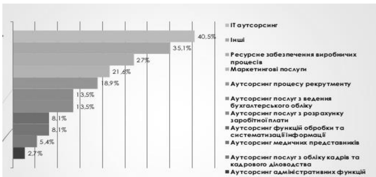
Рис. 2. Рейтинг аутсорсингових процесів в Україні [4, с. 108].

Із основними обсягами ринку аутсорсингу в Україні можна ознайомитися на рисунку 2.