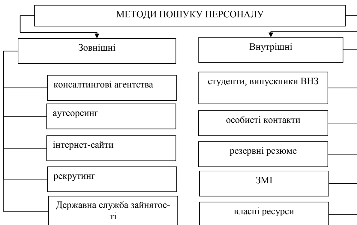
Рис. 1. Методи пошуку працівників у сучасних ринкових умовах господарювання.

Сьогодні на українському ринку праці значною мірою копіюють економічні механізми західних країн. Відповідно розширюється множина і різноманіття інструментів у сфері набору кадрів (рис. 1).