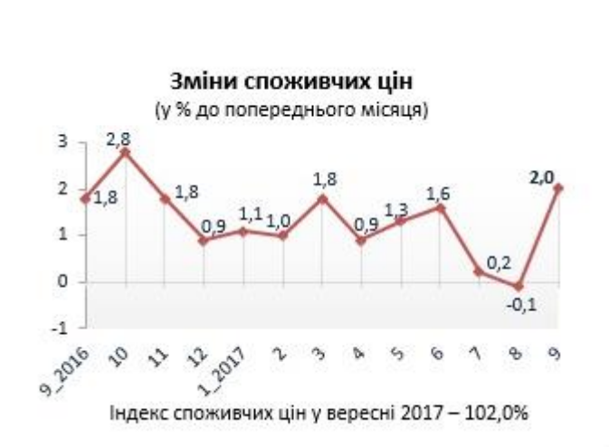
Рис.1 Джерело: [3]

нестабільність національної валюти як основного інструменту функціонування будь-якої ринкової економіки і фінансової системи. І навпаки, чим нижчий рівень інфляції, тим вищою буде макроекономічна стабільність, тим ефективніше функціонує грошово-кредитна та фінансова система.