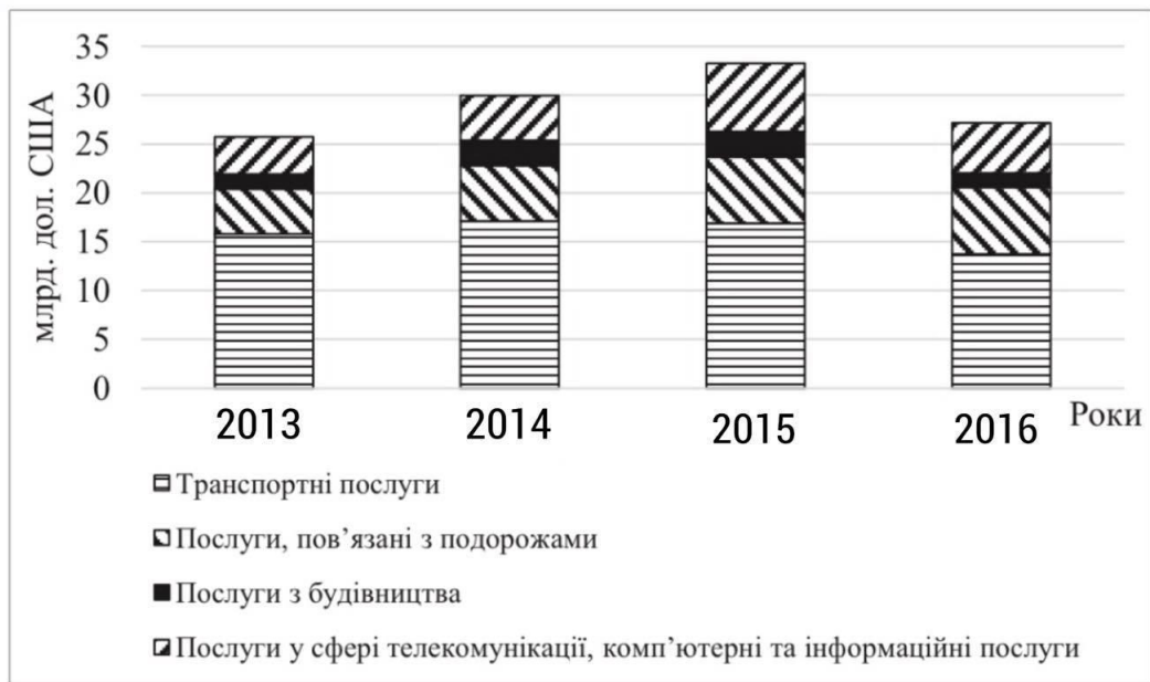
Рис. 2.2. Структура імпорту послуг України у 2013-2016 рр., млрд. дол. США [17]

Згідно до цих даних та аналізу сучасного національного ринку послуг України необхідно розвивати наступні види послуг[2]: