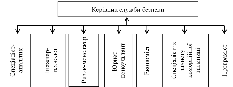
Рис. 1 – Базовий склад економічної безпеки підприємства (складено автором)

Типовий (базовий) склад служби економічної безпеки на підприємстві може включати керівника служби, економіста, юриста, ризик-менеджера, технолога, аналітика, програміста (Рис. 1).