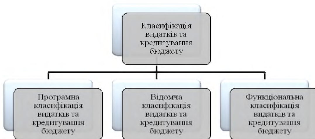
Рис. 1. Класифікація видатків та кредитування бюджету*