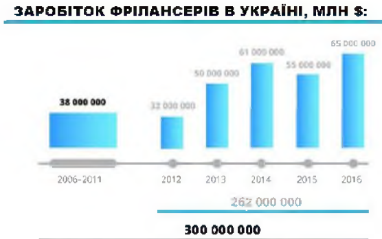
Рис. 3. Зарібок фрілансерів в Україні [2]

Фріланс, як вид трудового співробітництва, не набував би з кожним роком все більшої популярності, якби не можливість отримання гідної винагороди за виконану роботу. Як повідомляє STARTUP DEPOT LVIV, сумарний зарібок фрілансерів за останнє десятиліття склав понад $300 млн. (рис. 3)[2].