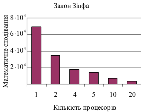
Рис. 1 – Математичне сподівання кількості паралельних порівнянь, необхідних для пошуку запису, у випадку розподілу ймовірностей звертання до записів за законом Зіпфа, різної кількості процесорів і N = 10^6

На підставі порівняння ефективності методу послідовного перегляду ( m=1 ) і методу m -паралельного послідовного перегляду доходимо висновку, що розпаралелювання методу послідовного перегляду веде до підвищення ефективності приблизно в m разів для всіх розглянутих законів розподілу ймовірностей звертання до записів, крім “бінарного”.