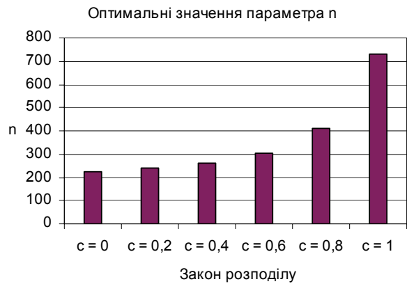
Рис. 4 – Оптимальні значення параметра n у випадку N = 10^6 та b_0/d_0 = 20 для таких законів розподілу ймовірностей звертання до записів: рівномірного ( c=0 ), узагальненого та Зіпфа ( c=1 )