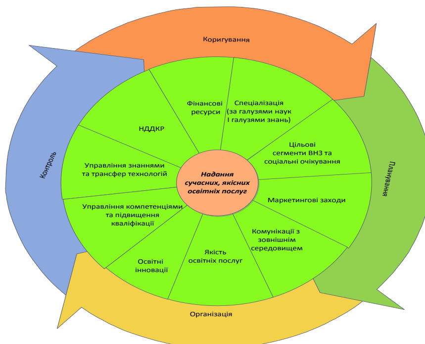
Рис. 2 Складові стратегії розвитку конкурентоспроможності персоналу в контексті мети діяльності ВНЗ