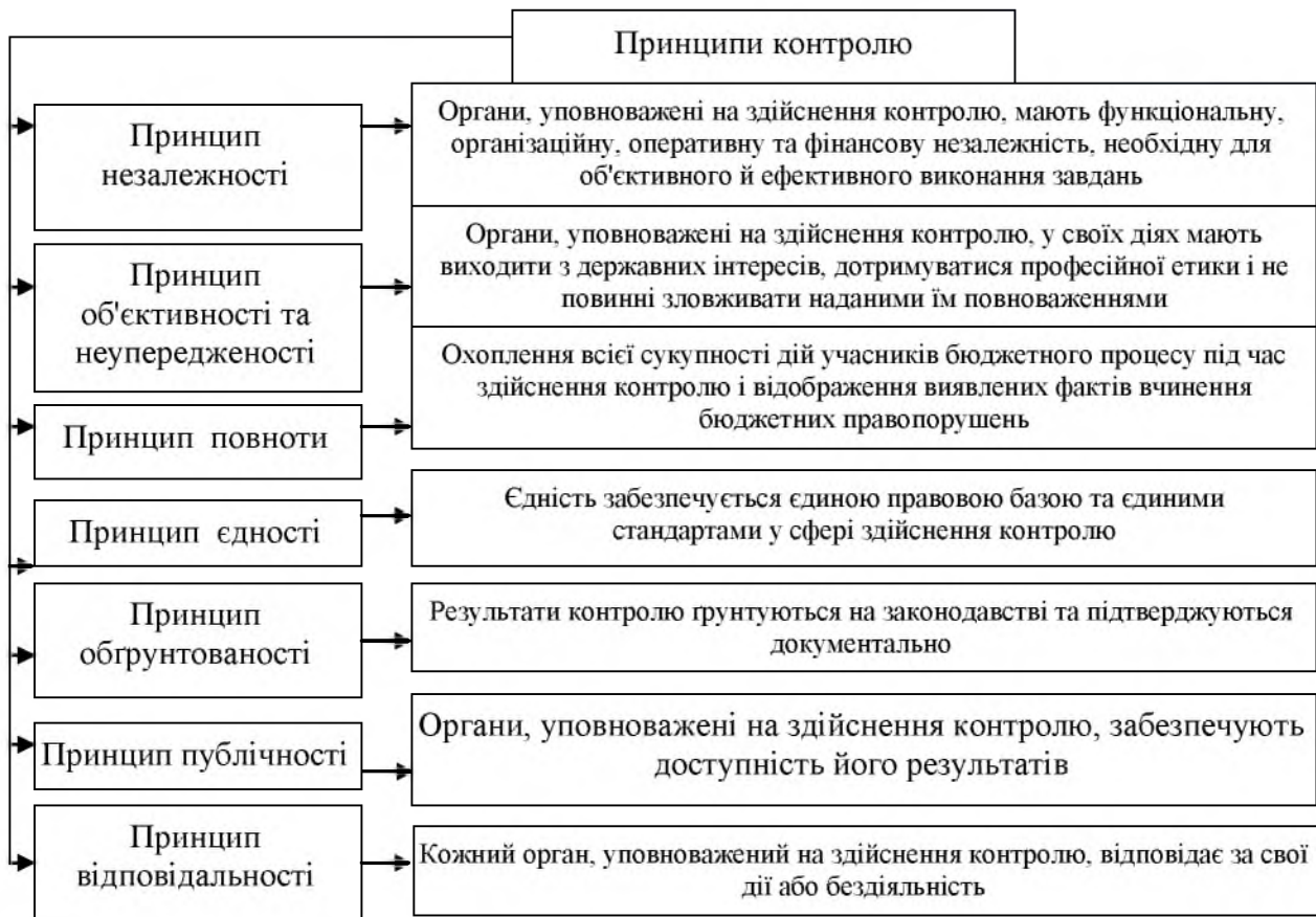
Рис. 3. Принципи контролю в бюджетних установах