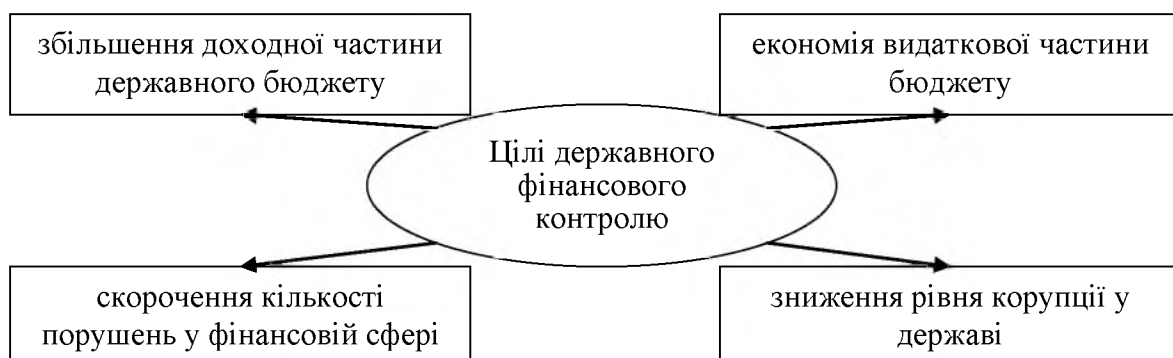
Рис. 1. Цілі державного фінансового контролю видатків бюджету

Основна мета здійснення державного контролю за бюджетними коштами – це забезпечення стабільного економічного розвитку країни. Цілі, які є невід'ємними складовими вищезазначеної мети, подано на рисунку 1.