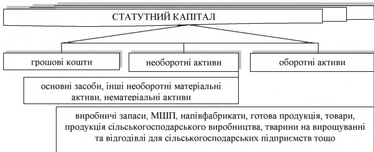
Рис.2. Активи, що формують капітал дочірнього підприємства

Таким чином, материнське підприємство до статутного капіталу дочірнього підприємства може вносити активи, визначені рисунком 2.