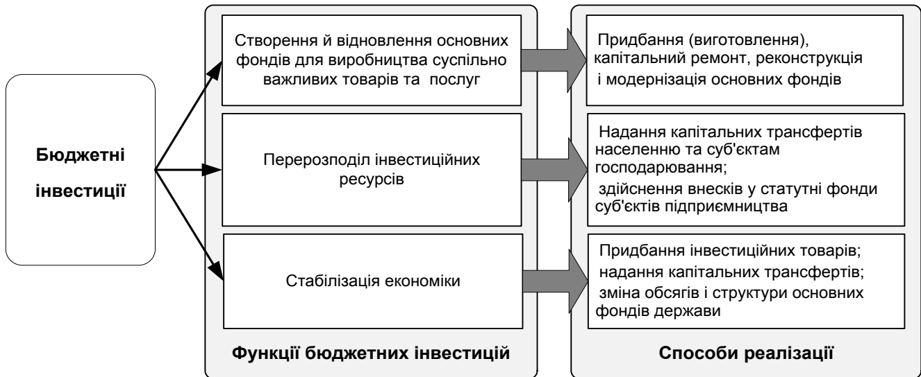
Рис. 1. Функції та інструменти бюджетних інвестицій.

цільових доходів спеціального фонду, джерел фінансування дефіциту бюджету для фінансового забезпечення інвестицій. На основі виявлених характерних особливостей перелічених джерел інвестування і відмінних рис різних видів бюджетних інвестицій обґрунтовано оптимальні напрямки використання бюджетних коштів для інвестиційних потреб.