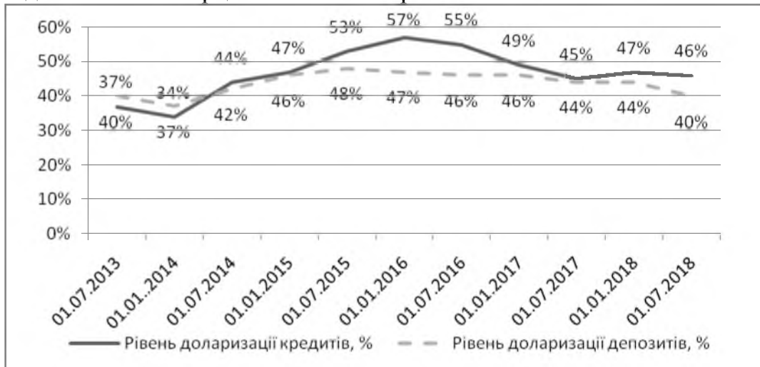
Рис. 1. Динаміка рівня доларизації кредитів та депозитів в Україні у 2013-2018 роках, %

На нашу думку, доцільно проаналізувати зміну динаміки рівня доларизації кредитів та депозитів в комерційних банках України.