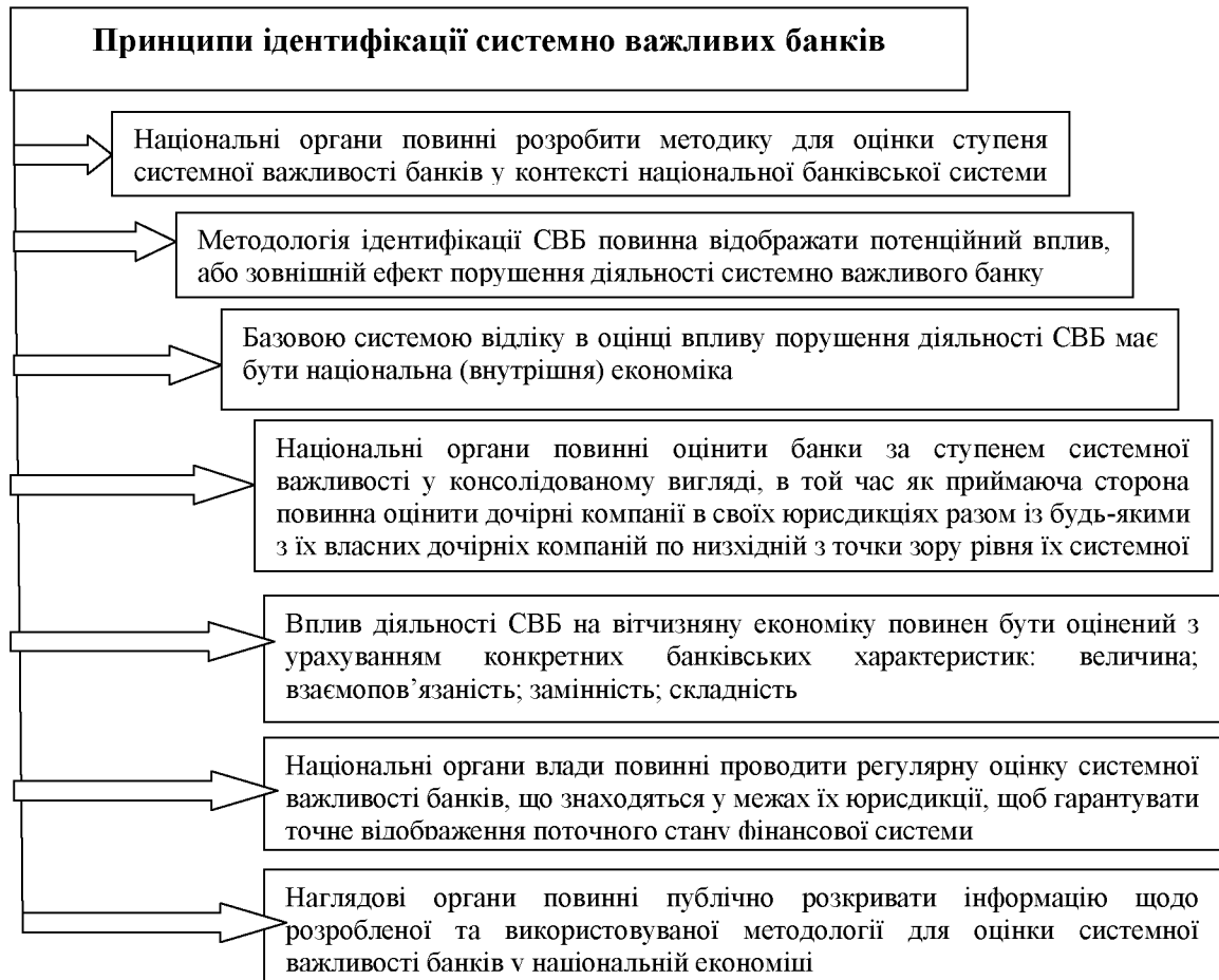
Рис.2. Принципи ідентифікації Н-СВБ, встановлені Базельським комітетом