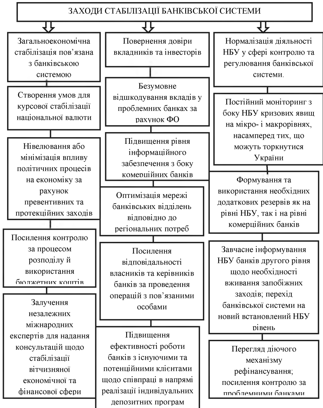
Рис. 2. Заходи щодо стабілізації банківської системи України [5]

Таким чином, основні заходи, які доцільно застосувати для стабілізації банківської системи України, ілюструє рис. 2.