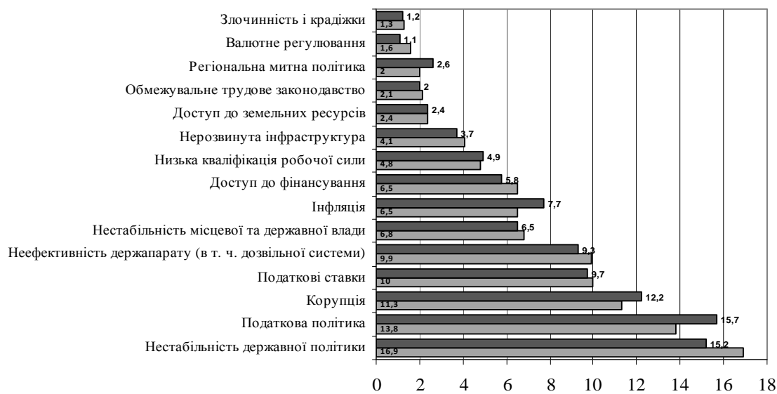
Рис. 3. Фактори, що впливають на конкурентоспроможність України та її регіонів [5, с. 63]

Найсуттєвішим бар'єром для ведення бізнесу в Україні є нестабільність державної політики. Так вважають керівники бізнесу в 21 із 27 регіонів України. На другому місці в рейтингу найбільш проблемних факторів для ведення бізнесу розташувався лідер торішнього рейтингу – податкова політика, яка втратила 2% у загальному обсязі відповідей. На відміну від 13 регіонів попереднього року, бізнес лише в 5 регіонах назвав податкову політику найпроблемнішим чинником за підсумками оцінки 2013 року. Корупція, як і раніше, займає третій рядок у рейтингу – з результатом 11,3%. Такі результати спеціального питання в рамках опитування більш ніж 2080 керівників компаній у 27 адміністративних регіонах України (рис. 3). Дане питання не входить до числа показників, які використовуються задля розрахунку індексу конкурентоспроможності, але воно дає розуміння тих проблем, які найбільшою мірою перешкоджають веденню бізнесу в регіонах України, на думку самого бізнесу.