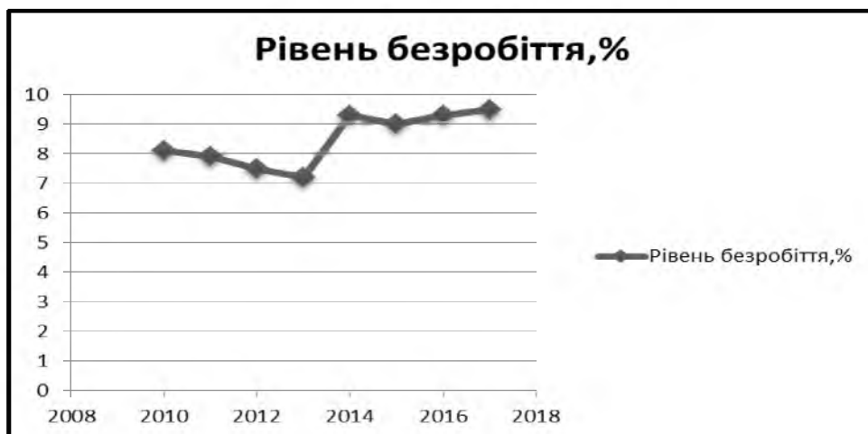
Рис. 2. Рівень безробіття населення у % до економічно активного населення України у віці 15-70 років

Впродовж 2010-2013 рр. динаміка рівня безробіття в Україні була спадною. Проте якщо у 2013 році рівень безробіття складав 7,2%, то вже у 2014 році цей показник зріс до 9,3%. Протягом наступного періоду (2014-2017 рр.) спостерігалася і зростаюча, і спадна динаміка цього показника, але загалом він зріс з 9,3% до 9,5% (рис. 2).