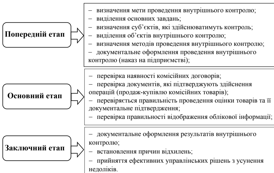
Рис. 1. Організація процесу здійснення внутрішнього контролю на підприємствах, які здійснюють комісійні операції

На основі проведеного дослідження нами виокремлено основні етапи організації внутрішнього контролю на підприємствах, які здійснюють комісійні операції (рис. 1).