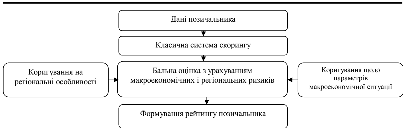
Рис. 3. Алгоритм скоригованої скоринг-системи оцінки позичальника [1, с. 180]

Скоринг являє собою математичну або статистичну модель, яка стає основою комп'ютерних прикладних програм. Самостійно банківським установам розробляти такі додатки є надзвичайно дорого, це потребує знання не лише банківської, а й комп'ютерної справи, програмування. Відтак, банки обмежуються придбанням скорингової карти для оцінювання платоспроможності позичальника у розробників скорингових рішень, однак рідко купують у того ж розробника програми для служб зі збору боргів. Нині розробників скорингових рішень фінустанови обирають, виходячи з цін на їхню продукцію і досвіду в цій сфері. У нас такі програми пропонують дві компанії: вітчизняна «Скорто Солюшенс» і міжнародна фірма «SAS», що працює з банками в усьому світі [1, с. 180].