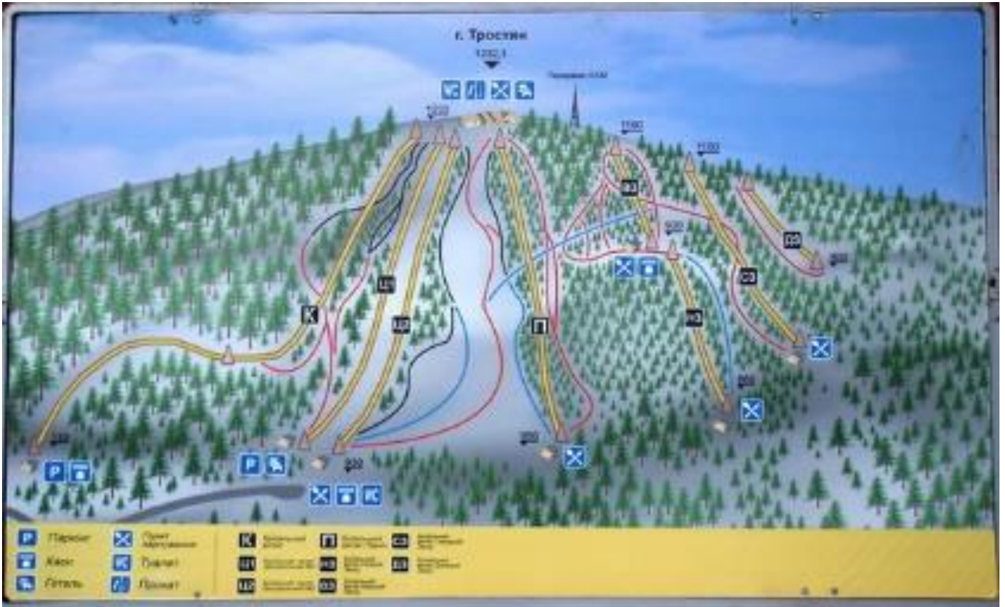
Карта гірськоколижних трас курорту Славське (гора Тростян)