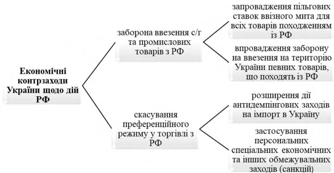
Рис. 2. Протидія України фінансовому тиску Російської Федерації