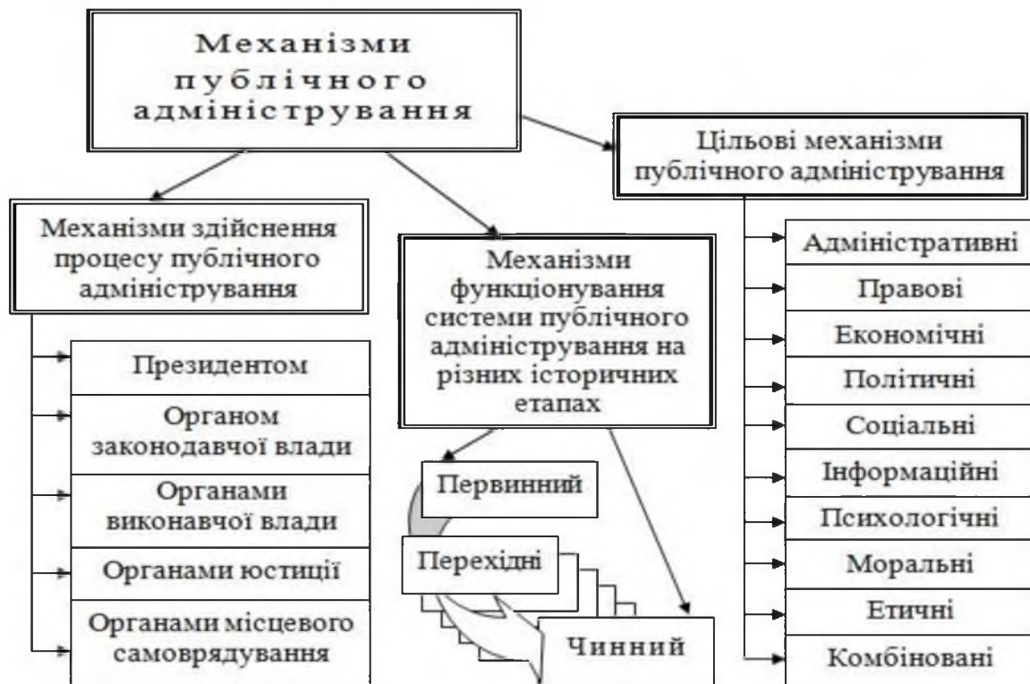
Рис. 1. Механізм публічного адміністрування

На думку Ю.П. Сурміна, “процес формування публічного управління, що відповідає викликам сучасності, є складним завданням, що постає перед усім суспільством та вимагає визначення методології як системи знань про метод, під яким зазвичай розуміється сукупність практичних або розумових прийомів, кроків та інструкцій, дотримання яких забезпечує досягнення бажаних результатів і виступає основою діяльності. Вона об’єднує компетентності, знання принципів, підходів, методів та інструментів діяльності [5].