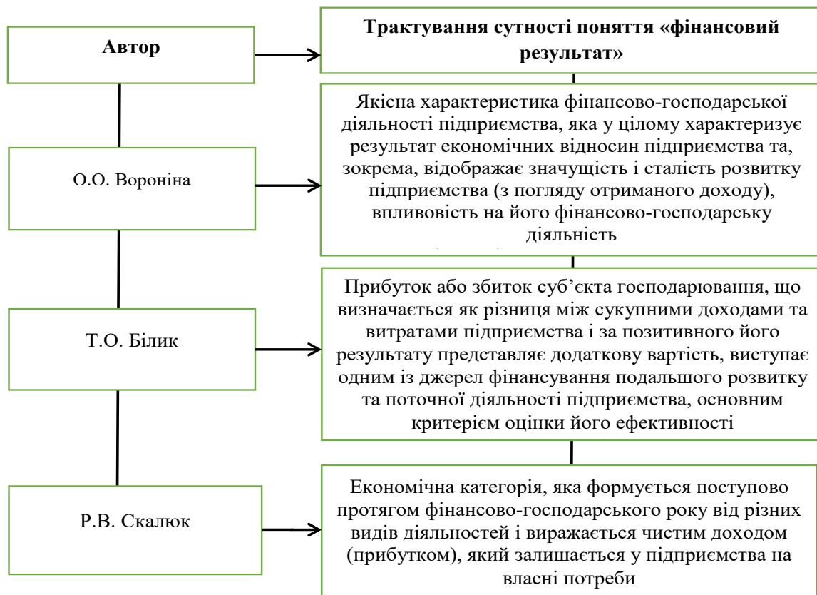
Рис. 1. Сутність категорії «фінансовий результат» (економічний аспект) [14, с. 230]

Метою виконання іншого завдання – зниження витрат – є планування, аналіз, оцінка та