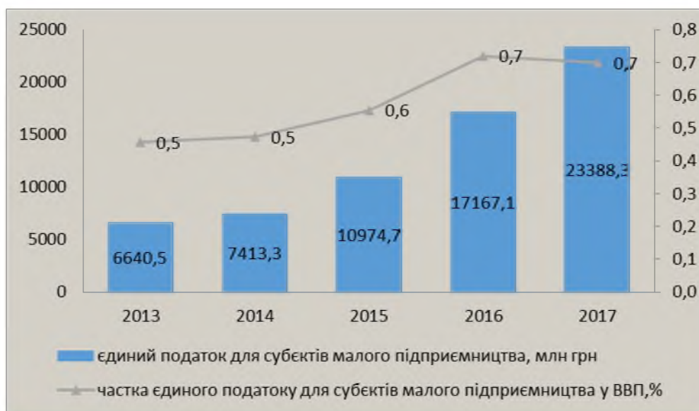
Рис. 3. Динаміка надходжень єдиного податку для суб’єктів малого підприємництва до місцевих бюджетів України за 2013-2017 роки.

Незважаючи на кризові явища в економіці, спричинені нестабільною економічною ситуацією в країні, зниженням підприємницької активності, збільшенням обмежень для платників єдиного податку, п’ятий рік поспіль продовжується зростання обсягів надходжень єдиного податку, сплаченого суб’єктами малого підприємництва, незважаючи на зменшення у 2017 році їх кількості. Динаміка надходжень єдиного податку для суб’єктів малого підприємництва в Україні за 2013-2017 роки відображена на рис. 3.