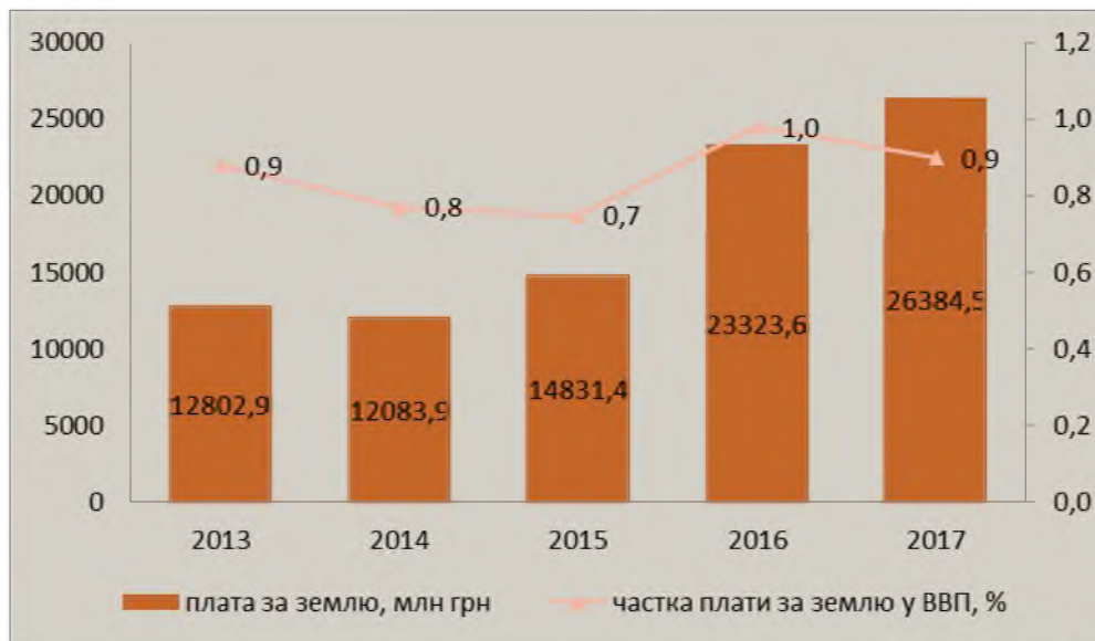
Рис. 2. Динаміка надходжень плати за землю до місцевих бюджетів України за 2013-2017 роки.

Зокрема, протягом 5 років найбільше надійшло з цього джерела у 2017 р. – 26384,5 млн. грн., що у 1,13 рази більше ніж у 2014 р. З 2013 по 2014 рік надходження були не значними – 12802,9 млн. грн та 12083,9 млн. грн. відповідно. Частка плати за землю у ВВП протягом досліджуваного періоду коливалась від 0,7% до 1%.