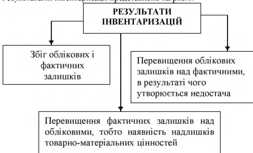
Рис. 1. Результати інвентаризацій

Результатами інвентаризації представлено на рис. 1.