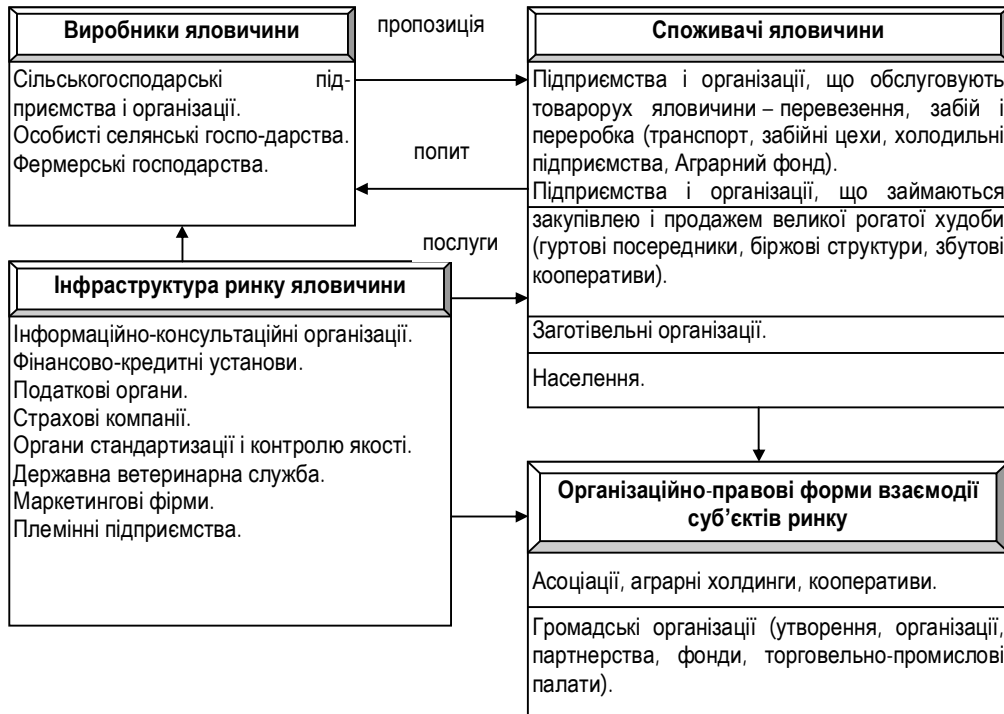
Рис. 2. Організаційне забезпечення функціонування м'ясного скотарства*