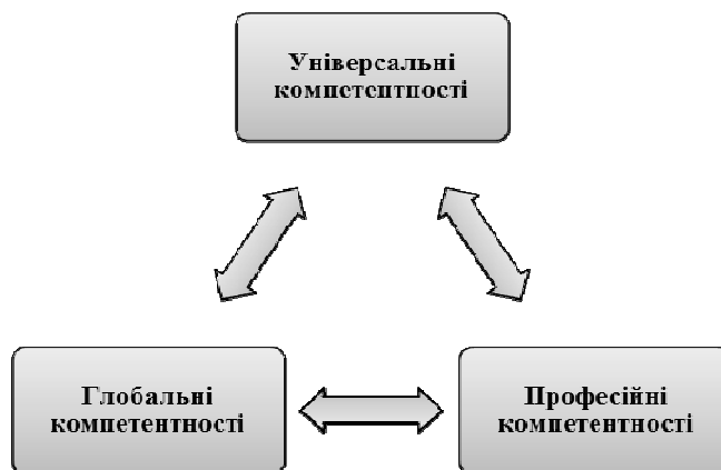
Рис. 2. Компетентності людини у XXI столітті

На нашу думку глобальні компетентності тісно пов'язані із універсальними та професійними, а також взаємодоповнюють один одного (рис. 2.). Незважаючи на різницю в їх спрямованості та масштабах (культурні відмінності або демократична культура, а не права людини або екологічна стійкість), ці компетентності мають спільну мету сприяти ефективній професійній реалізації громадянина, бути активним, корисним та свідомим членом суспільства.