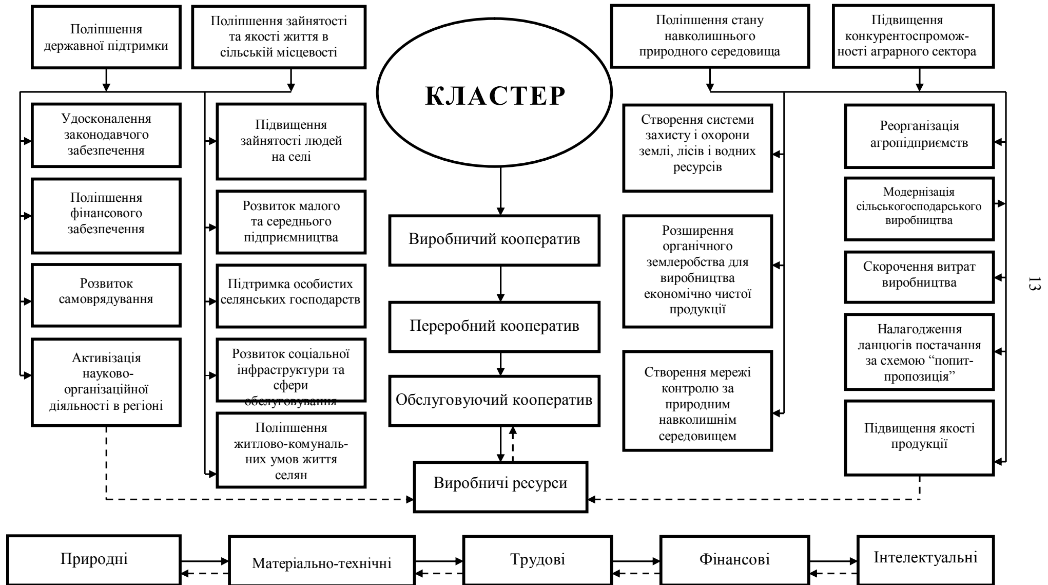
Рис. 3. Формування регіональних соціально-економічних кластерів та поліпшення зайнятості на селі