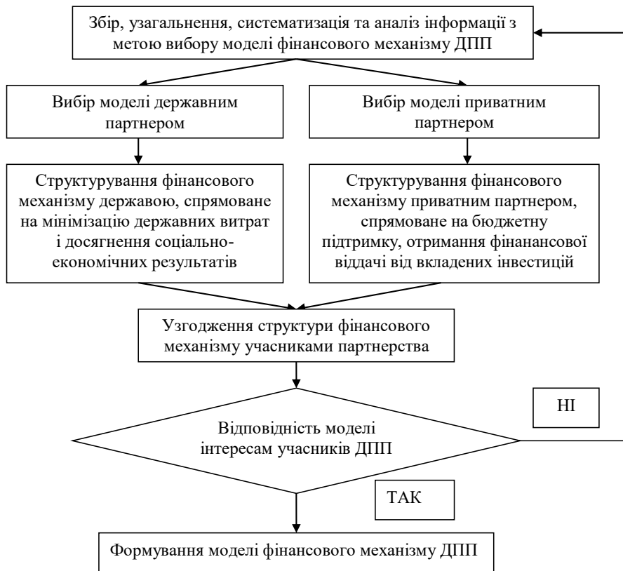
Рис. 2. Алгоритм формування моделі фінансового механізму державно-приватного партнерства відповідно до «каскадного підходу» Джерело: побудовано автором.