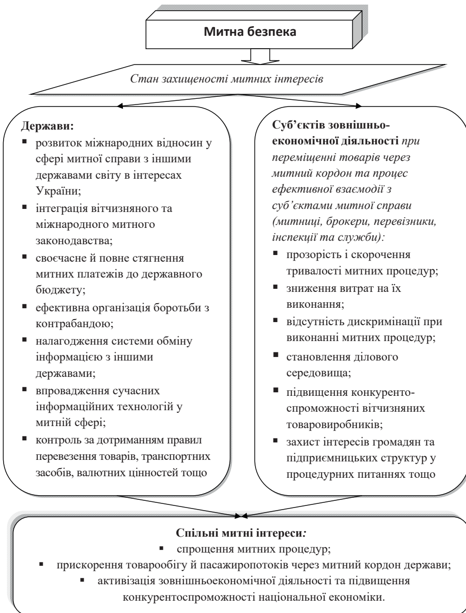
Рис. 2. Митні інтереси учасників ЗЕД [14]

Виконання економічної та правоохоронної функцій митними органами вказують на певну неузгодженість інтересів усіх учасників зовнішньоекономічних відносин та нескоординованість дій державних органів у фінансовій і митній сфері зокрема.