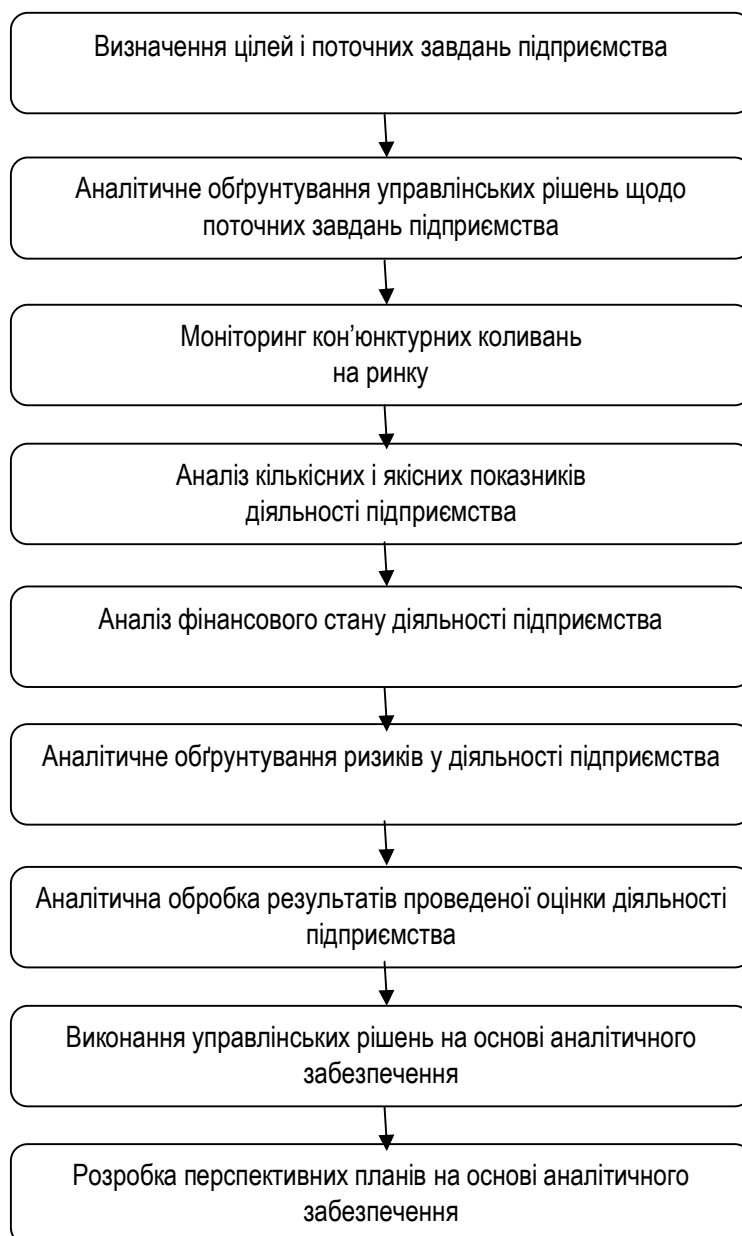
Рис. 2. Етапи аналітичного забезпечення прийняття та реалізації управлінських рішень