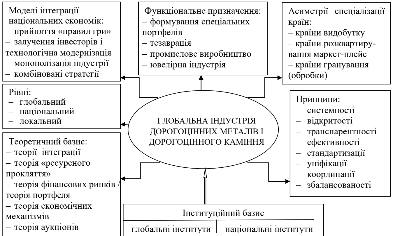
Рис. 1. Теоретико-концептуальна модель глобальної індустрії дорогоцінних металів і дорогоцінного каміння

Обґрунтовано, що багатofункціональність дорогоцінних металів і дорогоцінного каміння визначає специфіку функціонування їхніх ринків. З'ясовано, що дизайн ринку визначається невеликою кількістю учасників, які мають не лише природні поклади, але й технологічні переваги, здатні задовольнити запити кінцевих споживачів.