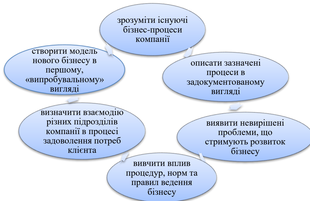
Рис. 3. Особливості зворотного реінжинірингу

Другим етапом реінжинірингу страхової компанії є опис (створення) моделі існуючої компанії. Найбільш ефективним є підхід, згідно з яким радикальні перетворення здійснюються тоді, коли зрозумілі труднощі та очікувані результати існуючого бізнесу. Відтак, створення моделі діючої компанії (зворотний реінжиніринг) дасть змогу (рис. 3):