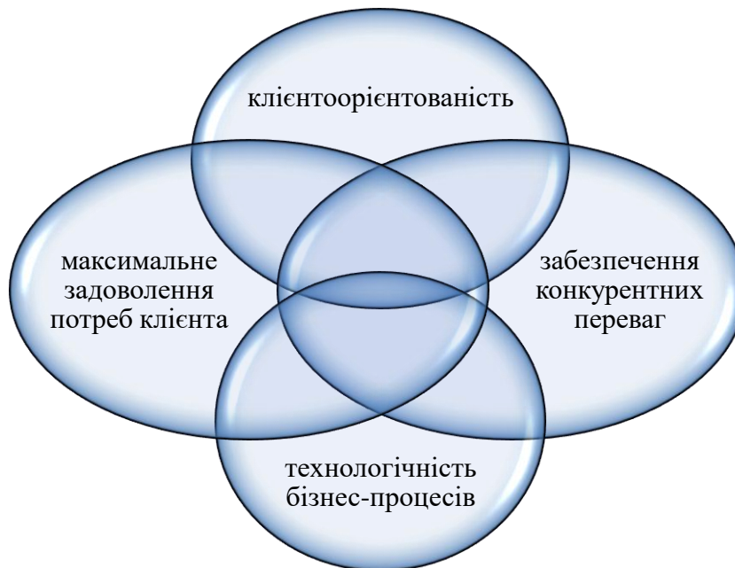
Рис. 1. Основні критерії успіху реінжинірингу в страховій компанії

задоволення потреб клієнта в страховому захисті, забезпечення конкурентних переваг, технологічність бізнес-процесів (рис.1).