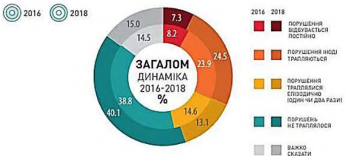
Рис. 3. Порушення прав громадянина або прав близьких для нього людей Примітка: складено автором за [4].

Наявність ситуацій, коли права громадянина або права близьких для нього людей порушували, зображено на рис. 3.