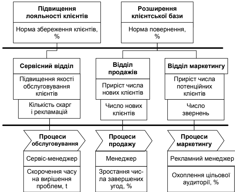
Рис. 3. Приклад декомпозиції (каскадування) стратегічних цілей

Другим елементом процесу планування роботи є визначення стилю управління виконанням робіт працівника. Для цього керівник діагностує рівень розвитку працівника для кожної з його цілей і KPI. Для підтримки мотивації на даному етапі менеджер надає можливість підлеглому здійснити самодіагностику, яка потрібна для досягнення виваженого компромісу в цьому питанні.