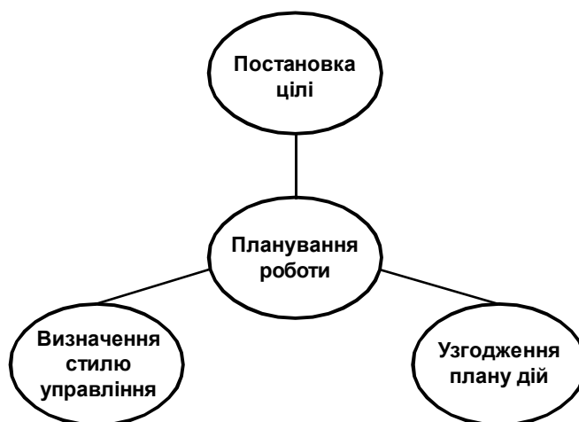
Рис. 2. Зміст етапу планування роботи

Отже, працівників можна успішно стимулювати за допомогою чітких і досяжних цілей. Проте цілі індивідів відрізняються від цілей організації, оскільки: їх менше; вони розраховані на коротші проміжки часу; індивідуальні цілі припускають менші невизначеність і ризик. Для сполучення двох мотиваційних прийомів – орієнтації на працівника й орієнтації на організацію – необхідно застосувати відповідні підходи до постановки цілей і завдань робітникам (управління за цілями; ключові показники ефективності; система стратегічних показників [2]).