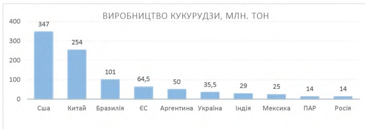
Рис.2. Топ-10 країн-виробників кукурудзи у 2019-2020 маркетинговому році*

Кожного року у світі виробляється кукурудзи більше, ніж будь-яких інших злакових культур. Кукурудза є «королевою» полів не лише для республік колишнього СРСР, де її так назвали, а й для всього світу. Із часткою 42% вона витіснила з першого місця пшеницю і стала лідером зернового балансу планети. Це означає, що вона диктує свої умови на глобальному ринку зерна. Упродовж останніх десяти років обсяги її виробництва постійно зростали[3].