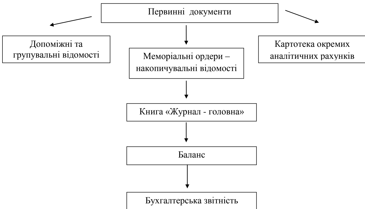
Рис. 2.1. Загальна схема меморіально-ордерної форми бюджетного обліку

ведуть відповідно в Меморіальних ордерах, які були зазначені вище. Також можна відобразити схему обліку. (див. Рис 2.1)