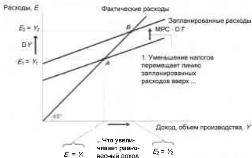
Рис. 1. Влияние налогового мультипликатора на динамику ВВП

При любом уровне дохода Y запланированные расходы теперь больше. Как видно из рис. 1, линия запланированных расходов перемещается вверх на MPC \cdot \Delta T . Состояние равновесия экономики перемещается из точки A в точку B .