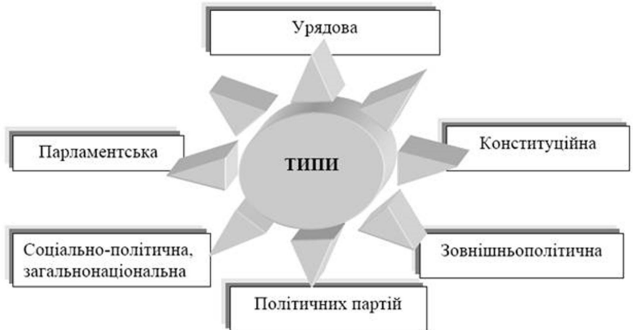
Рис. 18.2. Типологія політичних криз

Важливу роль у виникненні політичної кризи відіграють такі фактори, як відчуження народних мас від держави, органів державної влади, місцевого самоврядування; низький рівень громадської самосвідомості мас, незадовільна інформованість їх про реальний стан справ; високий рівень активності опозиційних структур; позиція засобів масової інформації; нерішучість, некомпетентність відповідальних осіб.